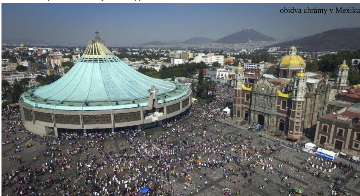
obidva chrámy v Mexiku

Ročne ho navštívi 20 miliónov pútnikov z rôznych kontinentov. Prvý chrám bol postavený v r. 1709, ale v r. 1976 vzhľadom k tomu, že pôvodná stavba začala klesať, postavili v jeho blízkosti novú veľkokapacitnú Baziliku Našej Pani z Guadalupe, v ktorej je 10 tisíc miest na sedenie.