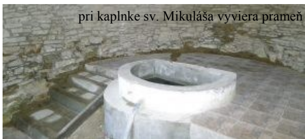
pri kaplnke sv. Mikuláša vyviera prameň

Na mieste prvého zjavenia svätca dnes stojí kaplnka sv. Mikuláša, kde sa nachádza aj vzácna relikvia - fľaštička s tekutinou vytekajúcou myrom z jeho hrobky v talianskom Bari.