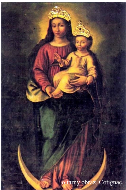
oltárny obraz, Cotignac