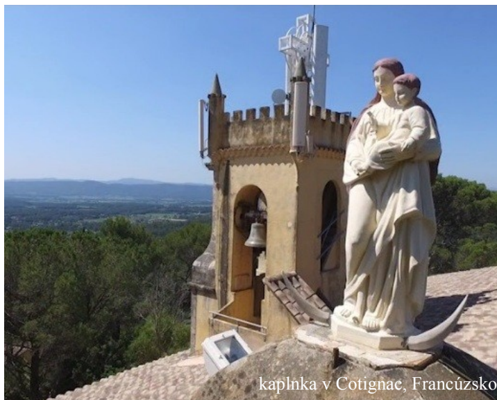
kaplnka v Cotignac, Francúzsko