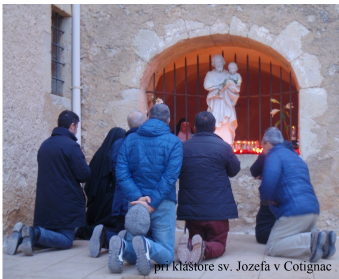
pri kláštore sv. Jozefa v Cotignac

Dňa 21. februára 1660 prišiel Ľudovít XIV. so svojou matkou Annou do Cotignac, aby osobitne poďakoval za svoje narodenie. Rok potom, čo kráľovná Anna zomrela (1666), umiestnil Ľudovít XIV. (Louis-Dieudonné) plaketu v svätyni Panny Márie Milosti na počesť svojej matky a pripomenul, že bol darovaný ľudom podľa sľubu Panny Márie kráľovnej Anne. Plaketa sa tu nachádza dodnes. Ľudovít XIV. sa stal najdlhšie vládnucim európskym panovníkom – 72 rokov. Prerokovali ho aj neslávne činy.