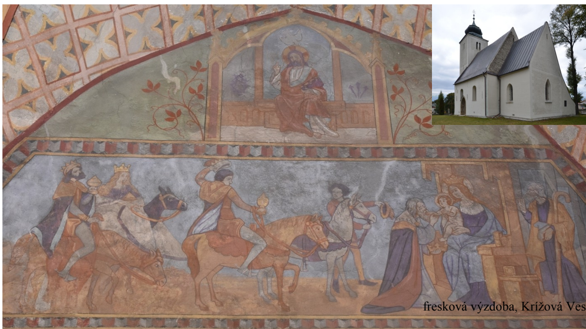
fresková výzdoba, Krížová Ves