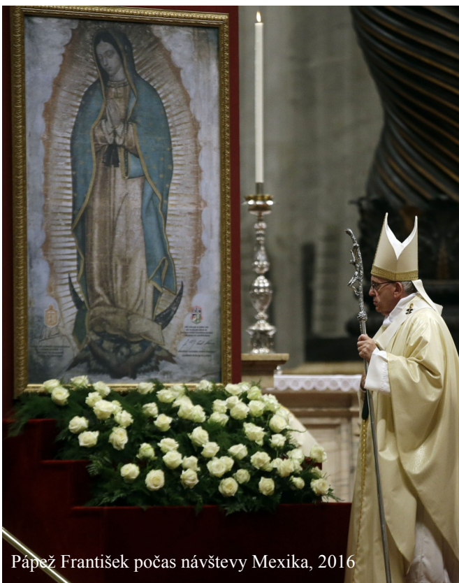
Pápež František počas návštevy Mexika, 2016

„Požehnaná Panna Mária, Matka peknej lásky, ochraňuj naše rodiny, aby stále jedno boli a požehnaj výchovu našich detí. Ty, naša nádej, pozri so zmilovaním na nás. Uč nás stále ísť k Ježišovi. Pomôž nám znovu vstať, keď padneme, aby sme sa k Nemu znovu vrátili, s tým, že svoje chyby a hriechy priznáme vo sviatosti pokánia, ktorá dáva duši pokoj. Prosíme Ťa, daj nám veľkú lásku ku všetkým sviatostiam, ktoré sú znamením a ktoré na Zemi zanechal Tvoj Syn. Tak budeme my, Najsvätejšia Matka, s pokojom Božím vo svedomí, so srdcom oslobodeným od zloby a nenávisťi, môcť priniesť pravú radosť a pravý pokoj, ktorý prijímame od Tvojho Syna, nášho Pána Ježiša Krista, ktorý vládne s Bohom Otcom a Duchom Svätým, na veky vekov. Amen.“ (úryvok modlitby sv. Jána Pavla II. pri návšteve Mexika v r. 1979)