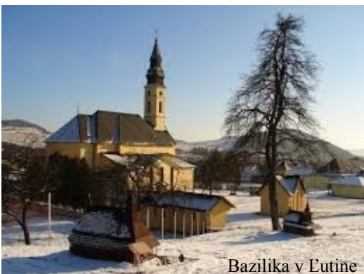
Bazilika v Lutine

Vďaka angažovanosti pútnikov postavili v r.1854 v Lutine kaplnku Usnutia Presvätej Bohorodičky. V r.1878 sa vybudovali kaplnky Sv. Anny a Sv. Kríža a v r.1930 aj kaplnku sv. Mikuláša nad prameňom vody, na mieste prvého zjavenia.