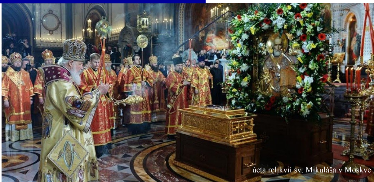
úcta relikvií sv. Mikuláša v Moskve

Mnohí máme ešte v sebe malé dieťa, ktoré si 5 decembra večer starostlivo poumýva čižmičky a teší sa na návštevu najmilšieho svätého - sv. Mikuláša. Z generácie na generáciu sa ozýva v našich domovoch známe: „Mikulášku, dobrý strýčku modlím sa ti modlitbičku...“