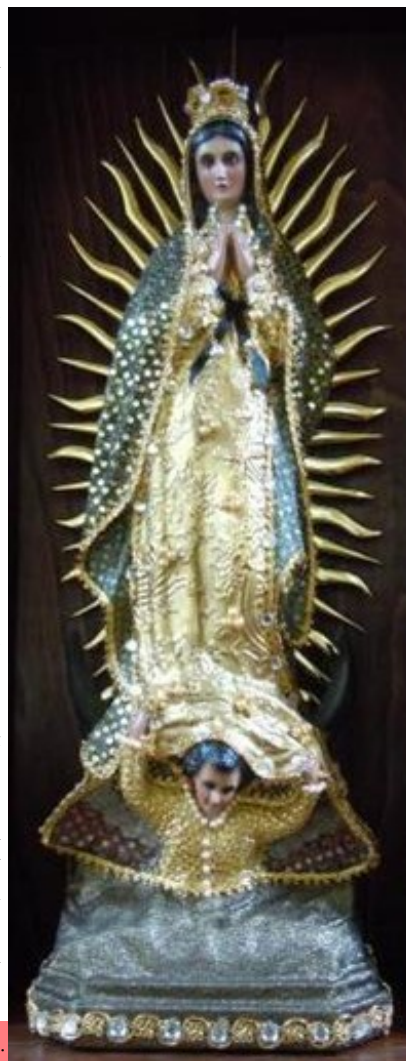
Soška Panny Márie z Guadalupe na pútnickom mieste Skalka pri Trenčíne.

Matkou oboch Amerík nazval Pannu Máriu z Guadalupe sv. pápež Ján XXIII. Panna Mária sa v Mexiku zjavila práve vtedy, keď indiánsky národ prežíval veľmi ťažké obdobie španielskej kolonizácie, kedy bola ohrozená nielen samotná kultúra tohto národa, ale aj jeho vlastná identita. Zjavuje sa ako jedna z nich, ako žena z ich rasy, aby ich uistila, že je ich milujúcou Matkou.