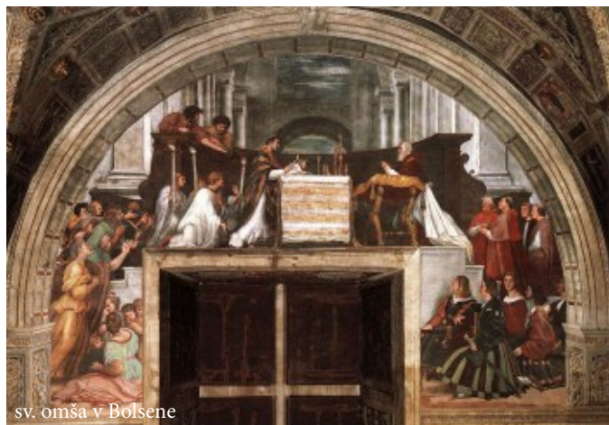
sv. omša v Bolsene

Sv. Tomáš Akvinský je ďalší svätec, ktorý sa významnou mierou zaslúžil o úctu Najsvätejšej Eucharistie. Sám je známy tým, že napriek svojej učenosti a múdrosti, dokázal veľmi dlho rozjímať o tajomstve Eucharistie. Napísal niekoľko oslavných hymnov, ktoré doteraz Cirkve používa ako piesne alebo hymny k oslave Sviatosti Oltárnej. Od pápeža dostal poverenie, aby napísal oficium, ktoré dostalo pomenovanie „zlatá brošňa“ jeho spisov.