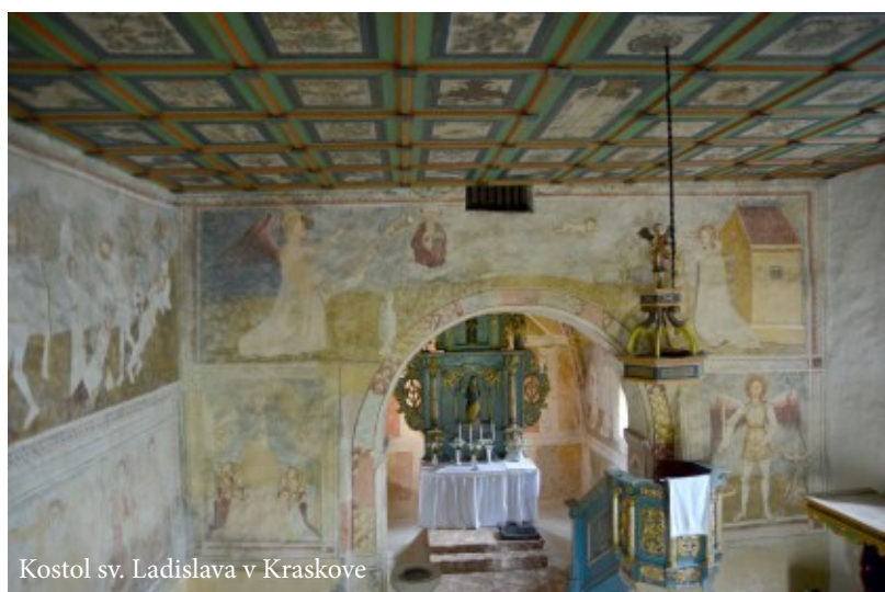
Kostol sv. Ladislava v Kraskove

Sv. Ladislav sa stal hrdinom legiend , ktoré sa zachovali v kronikách. Legendárne scény zo jeho života sa stali obľúbenou témou nástenných malieb kostolov. Najčastejšie ho zobrazovali ako rytiera v boji so štítom, na ktorom bol dvojkriž. Od 14. storočia sa jeho postava objavovala na minciach a jeho sochy spolu so sv. Štefanom sú súčasťou výzdoby starších kostolov. Sv. Ladislav patril k najväčším ctiteľom Panny Márie a tradícia hovorí, že jej zasvätil svoje kráľovstvo. Za svätého ho vyhlásil v r. 1192 pápež Celestín III.