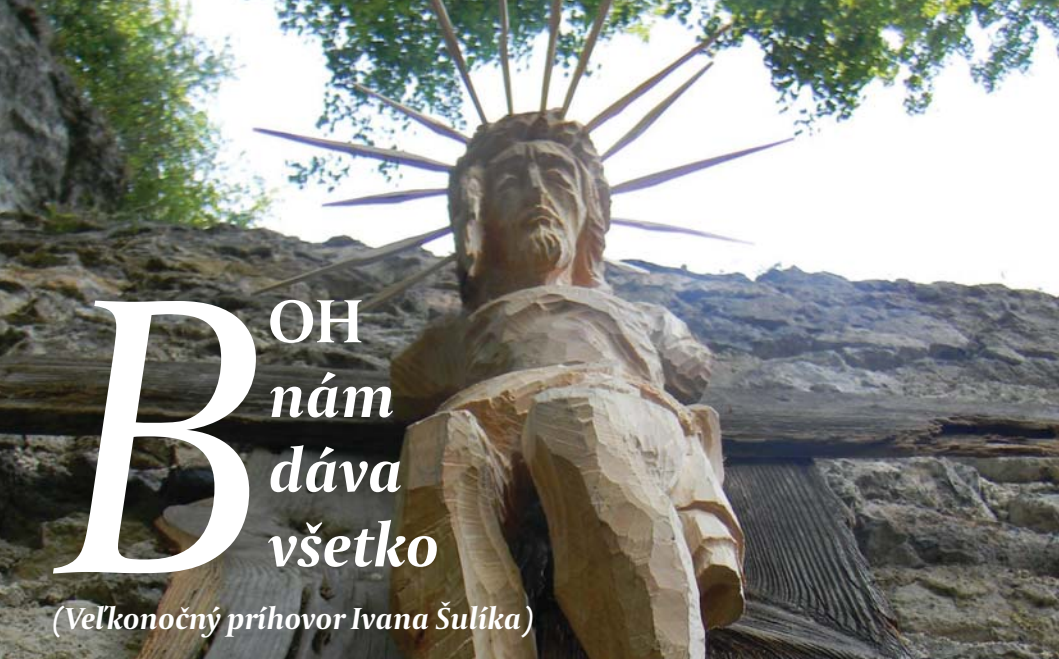
Krzysztof Bizuzan (PL): Krucifix zo Skalke (Detail), drevo, 2010. Sympozium Ora et Ars Skalke 2010.